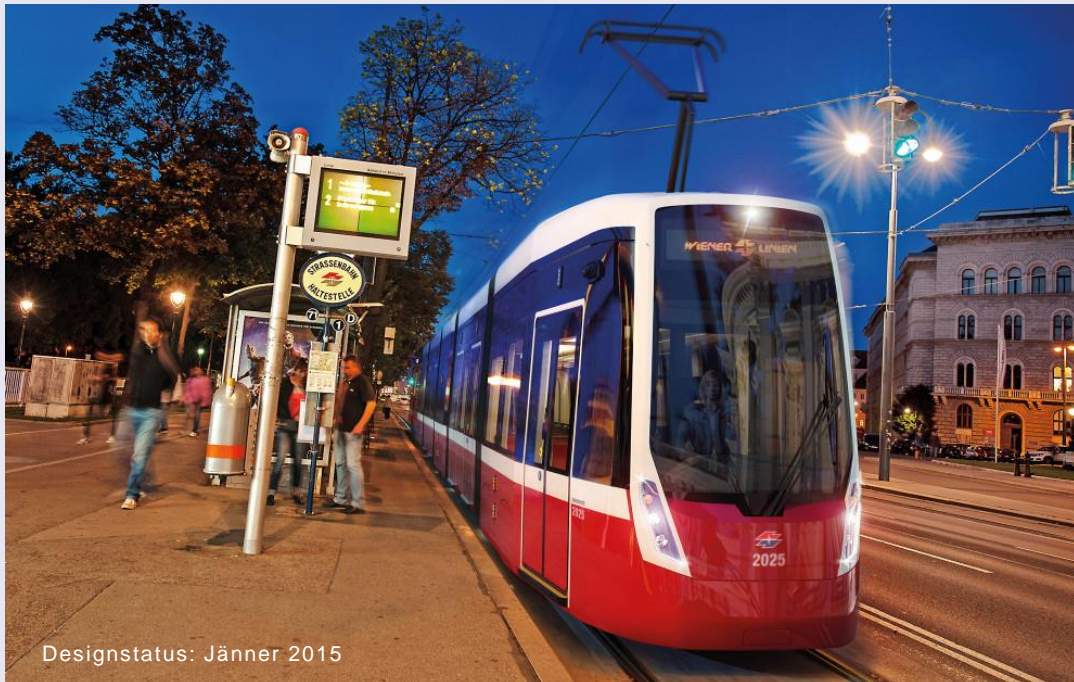
Designstatus: Jänner 2015

Wir sind besonders stolz, auch die zukünftige Straßenbahngeneration der Wiener Linien ausrüsten zu dürfen.