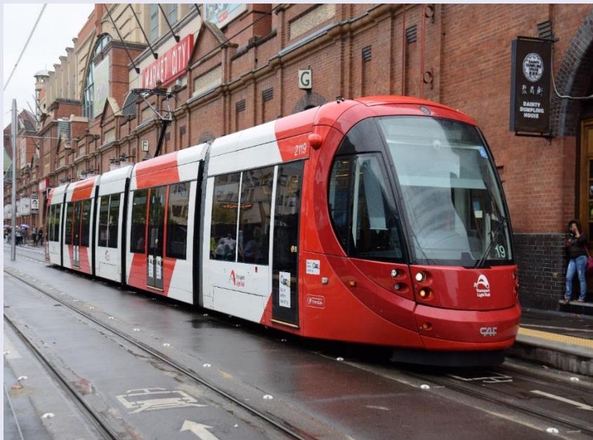
Eine Urbos 3 Straßenbahn in Sydney

In beiden Städten entschieden sich die Betreiber für die Urbos Straßenbahn von CAF, die schon in Sydney erfolgreich im Einsatz ist. Sowohl in Canberra als auch in Newcastle werden die Trams mit den robusten TSA Urbos-Doppelmotoren bestückt, welche demnächst in Wiener Neudorf für Down Under gefertigt werden.